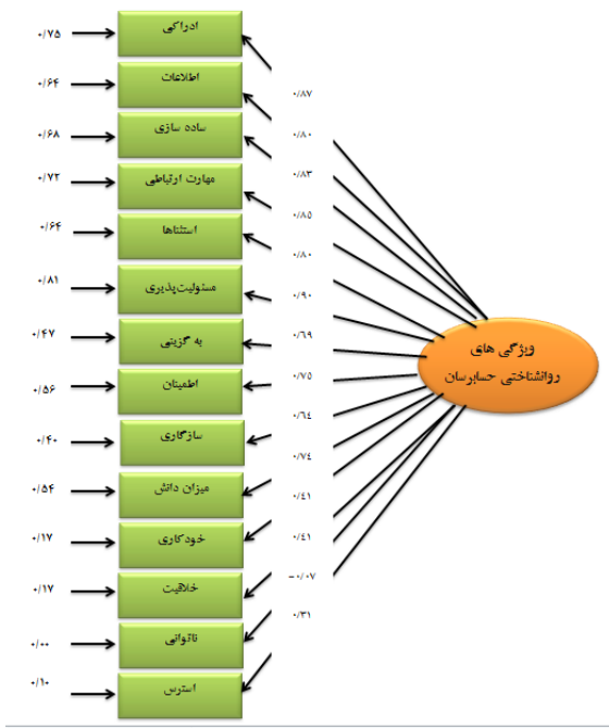
شکل ۲- ضرایب استاندارد مدل برآورد شده